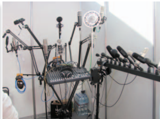
На стенде Rode