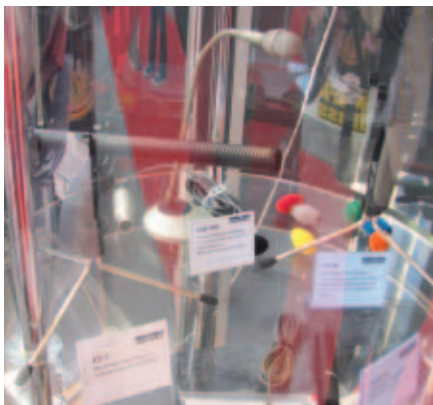
Микрофоны на стенде TBS

конденсаторный с минимальным уровнем собственного шума), M1, M2 (динамические для живого вокала), HS1 (тонкие головные с трехкоординатной регулировкой положения).